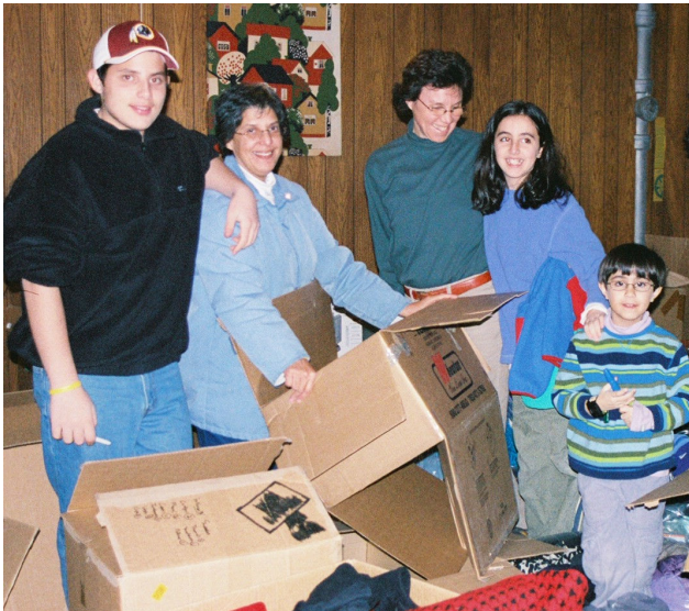
بسته بندی کمکهای زاموی به زلزله زندگان جنوب آسیا